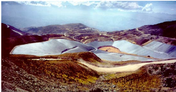
Foto 1: Instalación de lixiviación en pilas en los Andes (150 has., área principal)

Los revestimientos de geomembranas han sido utilizados en la industria minera aproximadamente desde de 1970, como respuesta a las necesidades de revestimiento en pozas de evaporación, presas de relaves y pozas de lixiviación en pilas. Las presas de relaves han sido históricamente revestidas de tierra en su mayoría, pero el uso de revestimientos de geomembrana ha aumentado en los últimos años. Las pozas de evaporación y de lixiviación en pilas son las aplicaciones más grandes en las que se utiliza geomembranas en la minería, y por ende serán el principal objetivo de esta visión general de la historia de este tipo de revestimientos. Se tocará el tema del estado histórico de esta práctica, además de los intereses más importantes en el campo de la ingeniería y los problemas emergentes en el campo de la lixiviación en pilas.